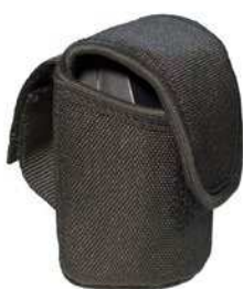
Etui de ceinture