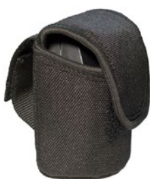
Etui de ceinture